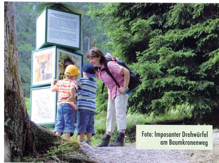
Foto: Imposanter Drehwürfel am Baumkronenweg

In Waldkirch entsteht eine unverwechselbare Freizeitattraktion.